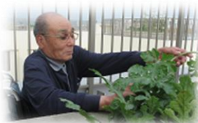
園芸・野菜の栽培